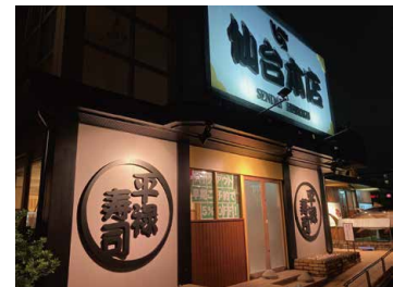
平禄寿司 仙台北店