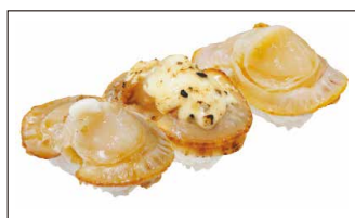
■ 青森県産 蒸しほたて三味 (蒸しほたて・タルタル焼き・醤油バター焼き)