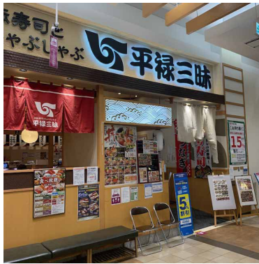
平禄三味 北海道イオンモール東苗穂店