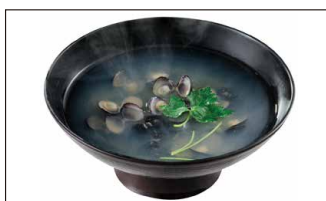
■ 十三湖のしじみ汁