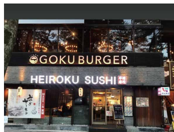
平禄寿司 東京渋谷 表参道店