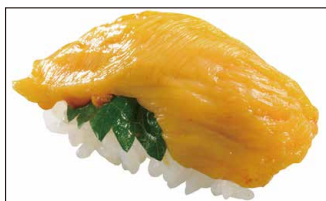
■ 三陸産 ほや握り