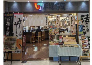
平禄寿司 札幌厚別 サンピアザ店