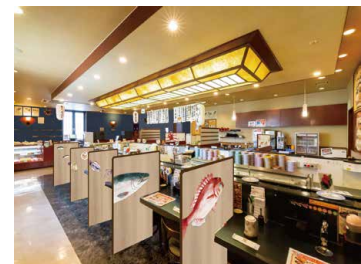
平禄寿司 仙台宮城野 新田東店 (店内)