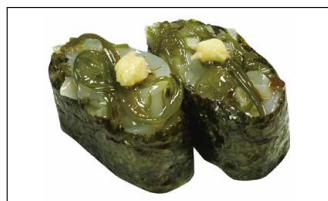
■ 三陸産 めかぶ軍艦