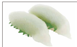
■ 青森県産 赤いか