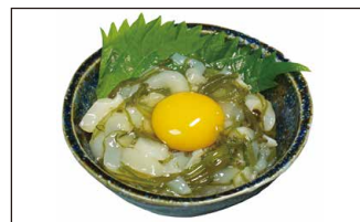
■ 三陸産 めかぶ月見小鉢寿司